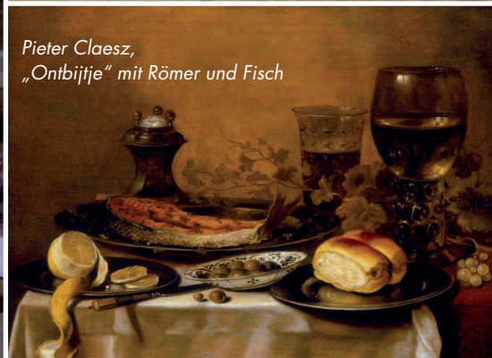
Pieter Claesz, „Ontbijtje“ mit Römer und Fisch